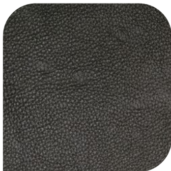
Ubod od insekta