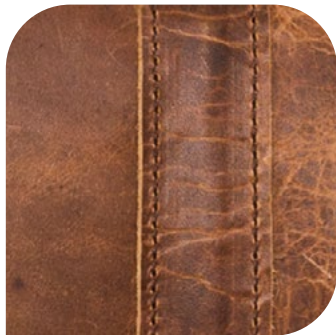
Razlika u strukturi