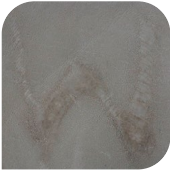
Otisci od žiga